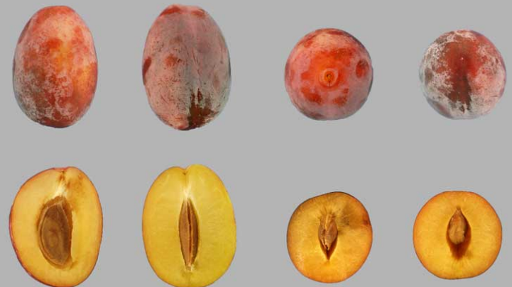
Pruneau du Flon, Vouvry