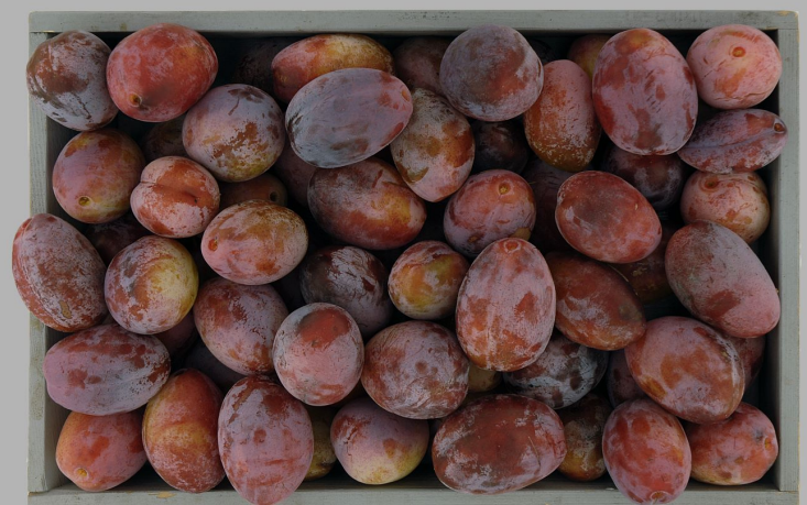
Pruneau du Flon, Vouvry