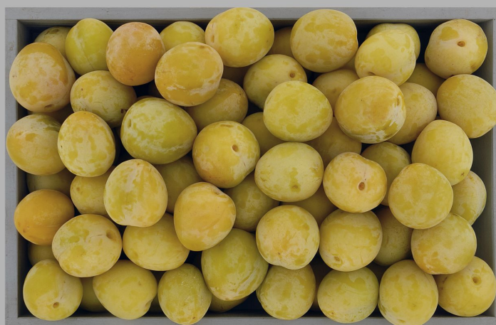
Prune Coco, (prune jaune)