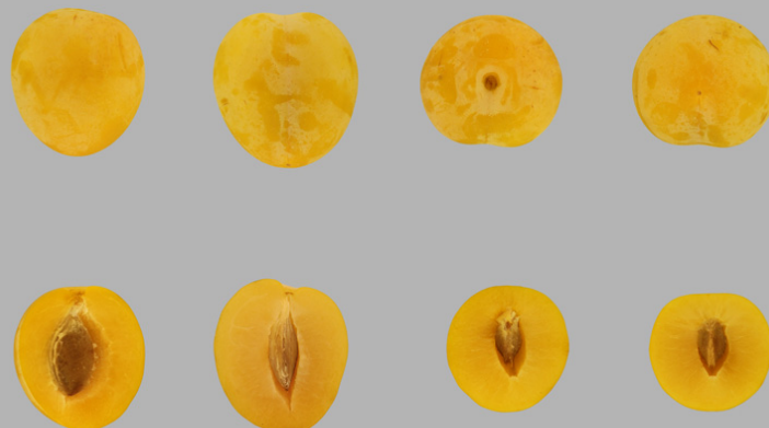
Prune Coco, (prune jaune)