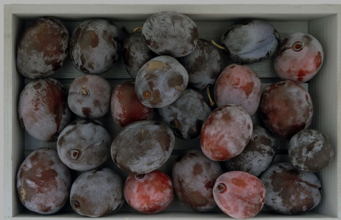
Prune Rosspflaume, Ried B. Brig