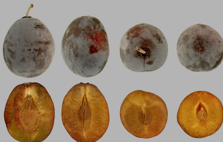
Prune Rosspflaume, Ried B. Brig