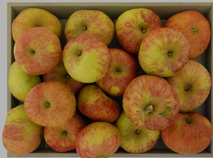
Pomme à Beignet, Ollon: Aulien