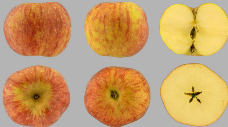
Pomme à Beignet, Ollon: Aulien