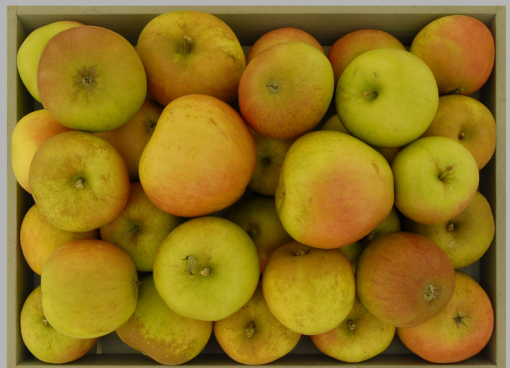
Pomme Reinette de Chevroux, Chevroux