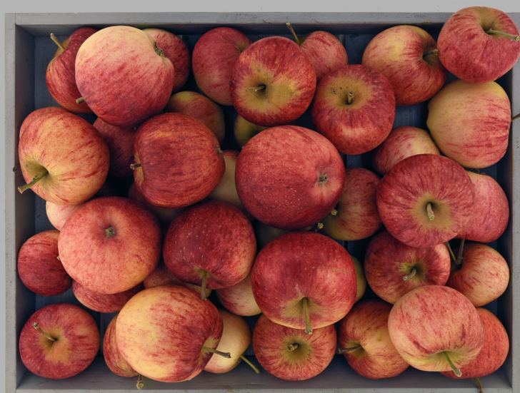
Pomme de la Prairie, La Chaux-de-Fonds