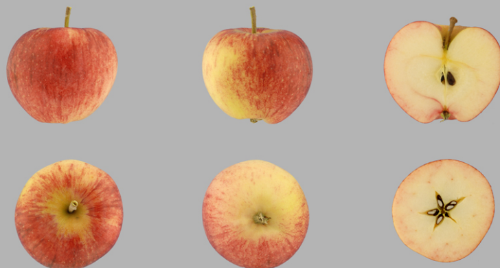
Pomme de la Prairie, La Chaux-de-Fonds