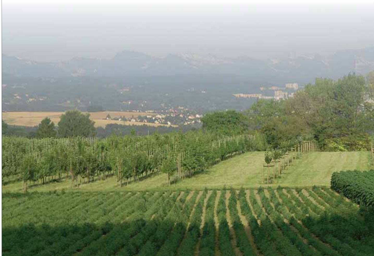
Vue du verger d'Aclens (VD)

Une évolution conséquente est à prévoir au gré de l'avancement des travaux concernant les variétés d'introduction et l'identification des éventuelles synonymies génétiques. Ces tâches mèneront à une réorganisation partielle de la collection.